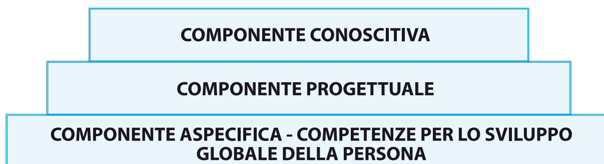
Figura 5: Le competenze orientative

Nell'ambito delle attività di formazione in servizio rivolte ai docenti è stato possibile riconoscere come le