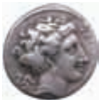
Moneta di Terina

Seminario Internazionale di Studi e Formazione