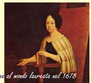
Elena Lucrezia Piscopia, prima donna al mondo laureata nel 1678

Call for papers: la proposta di contributi (relazioni, comunicazioni e poster) da sottoporre all'approvazione del Comitato Scientifico dovrà pervenire al La.R.I.O.S. ( larios@unipd.it ) entro il 30 dicembre 2012.